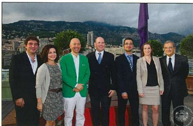
Inauguration du 01/10/2013