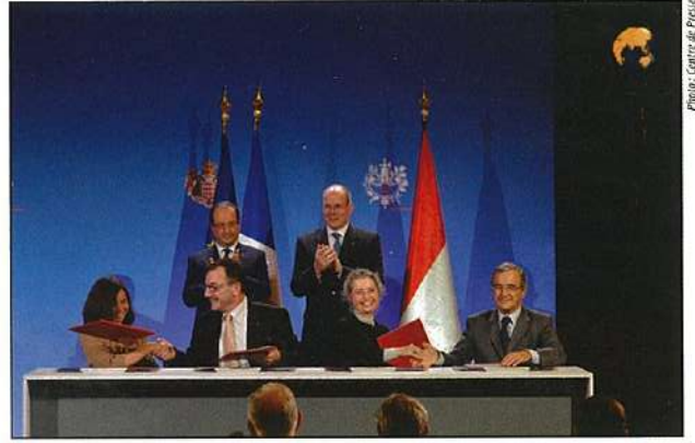
14 11 2013 - Signature de la convention de partenariat entre le CSM et l'Université de Versailles et entre le CSM/le CNRS et l'INSERM pour une convention de collaboration. 14 11 2013 - Signing of the partnership agreement between the CSM and the University of Versailles and between the CSM / CNRS and INSERM for a collaboration agreement.